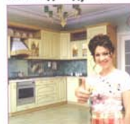
Кухня, где все под рукой. Теперь доступнее