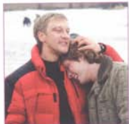
Фильм «Миннесота». Смотрите в ноябре