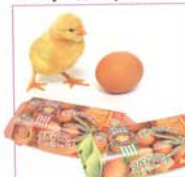
Вкуснее не бывает! Акция!